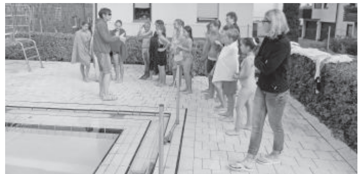
Einweisung vor dem Springen für die 4. Klasse

Trotz kühlem Wetter ließ sich die Sonne immer wieder blicken und so konnten rund 100 Schülerinnen und Schüler die erforderlichen Strecken für das Sportabzeichen schwimmen. Während meist vier Kinder nebeneinander schwammen, auf jeder Bahn ein Kind, feuerten die anderen der jeweiligen Klassenstufe am Rand oder am oberen Ende des Schwimmbeckens ihre Mitschüler lautstark an. Oft gingen auch die Blicke unter den Schwimmenden hin und her, um zu sehen, wie weit die „Konkurrenten“ sind.