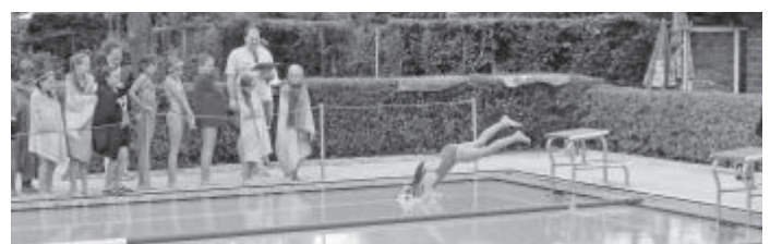
Klasse 4 beim Streckentauchen

Beim Springen vom Beckenrand, 1 m-Brett und 3 m-Brett war die Konkurrenz um die höchste Punktzahl sehr groß. Die Kinder fragten immer wieder, welcher Sprung die meisten Punkte erreichen würde und sprangen dann auch mutig vom 3 m-Brett, sogar mit Salto.