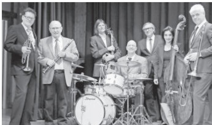
Flat Food Stompers

Während Fernsehaufnahmen für den SWR3 wurde die Gruppe als „die erfolgreichste Band“ beim Olymp Jazzfestival in Bietigheim-Bissingen bezeichnet. Weitere Pressestimmen: „Die Band spielt in der obersten Liga. Jazz vom Feinsten“, „Top-Liga der deutschen traditionellen Jazzbands“.