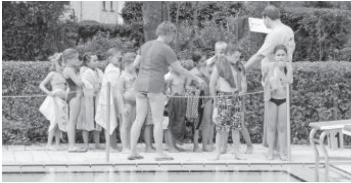
Startaufstellung der 1. Klasse

Dieser Tag konnte nur durch die Mithilfe vieler Mütter, Väter, Großeltern und Lehrerinnen ein schönes Erlebnis werden, die uns beim Zeitnehmen, beim Aufschreiben der Ergebnisse und Beaufsichtigen der Kinder geholfen haben. Vielen Dank dafür.