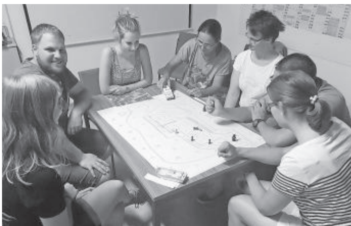
Abseits des Wassers - Planspiele für den Einsatz

Die regelmäßige Auffrischung praktischer und theoretischer Inhalte in der Wasserrettung sind für die Einsatzkräfte dabei sehr wichtig um für den Ernstfall vorbereitet zu sein. Beim AfterWork am Freitag, 23. Juni 2017 übten die Teilnehmer daher die Koordination von Rettungsschwimmern im Freibad anhand mehrerer Planspiele.